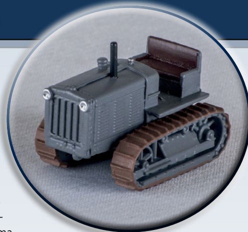
Alle Fotos zeigen Handmuster/Fotomontagen.

Erscheinen mittlerweile über 8 Jahre zurückliegt. Seither sind nun fast 2.000 neue Mitglieder unserem Club beigetreten, zahlreiche von ihnen trugen immer wieder den Wunsch nach einer Neuauflage dieses Zuges an uns heran. Da für uns jedoch aufgrund der Exklusivität der damaligen Hilfszug-Modelle eine bloße Neuauflage nicht in Betracht kam, haben wir uns für folgendes entschieden: Der Standard-Hilfszug der DR wird im nächsten Jahr in einer gealterten Ausführung erscheinen, natürlich mit neuen Wagennummern. Die Alterung wird in einer leichten, "dezenten" Art erfolgen, denn zum einen waren die Züge beim Vorbild nur selten übermäßig ver-