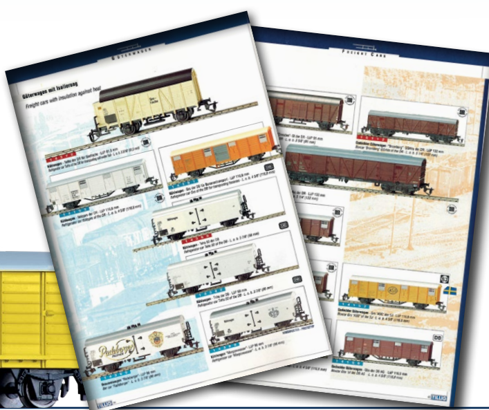
Abb.: Ausschnitt aus TILLIG-Katalog 1996/97 mit den früheren Gbs-Modellen