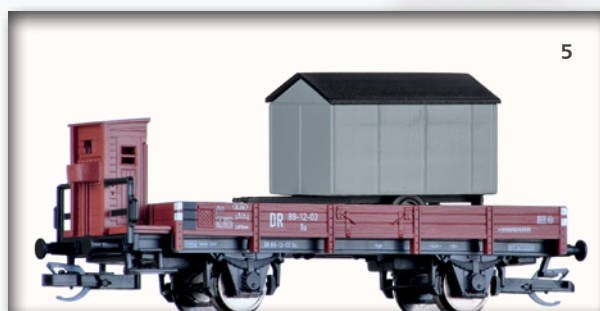
Abb. 4/5: Niederbordwagen mit Bauwagen als Ladegut.