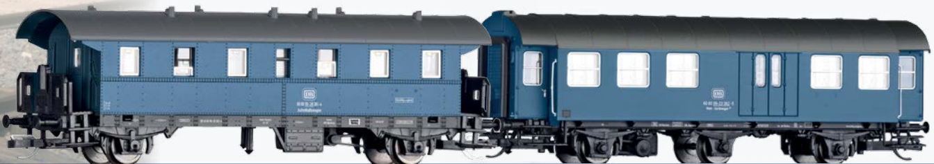
Abb. 11: Mit diesem zweiteiligen Set wird die beliebte Bauzug-Serie der Deutschen Bundesbahn fortgesetzt.