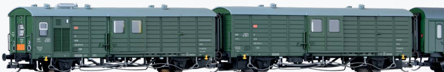
Abb. 15: TT-Modelle des geplanten Sets Art. 502606.