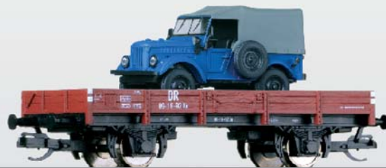
Abb. zeigt Wagen mit Epoche-III-Beschriftung.

Niederbordwagen Kklmo der DR, Epoche IV mit Ladegut (Art. 501296) Mit diesem Modell setzen wir 2013 das diesjährige Thema „Fortschritt“ weiter fort: Ein Niederbordwagen Kklmo, beladen mit einem Geländewagen GAZ-69. Das Vorbild dieses Straßenfahrzeuges wurde bis Anfang der 70er Jahre in der ehemaligen Sowjetunion hergestellt und zunächst vornehmlich für die Streitkräfte eingesetzt. Als besonderes Unikat existierte auch ein Exemplar in „Fortschritt-Blau“, welches Sie exklusiv bei diesem Modell wiederfinden. Das TT-Modell des GAZ-69 wird mit abnehmbarer Plane geliefert (Preis 29,00 EUR).