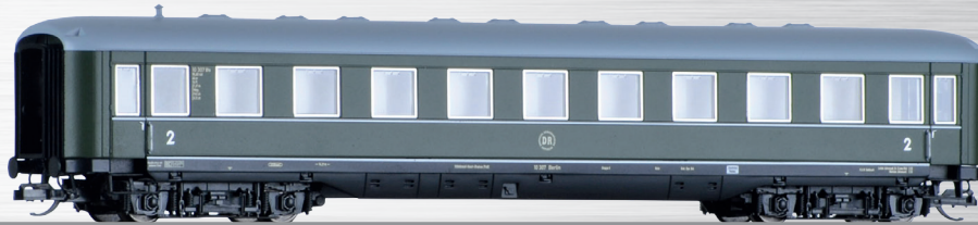
Art.-Nr.: 502101 Schlafwagen der DR, Ep. III