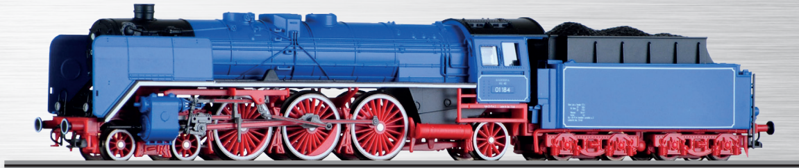
Art.-Nr.: 502098 Dampflokomotive 01 184 „Kolonnenlok“, Ep. III