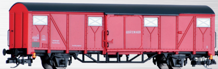
Art.-Nr.: 501896 Gerätewagen Feuerwehr